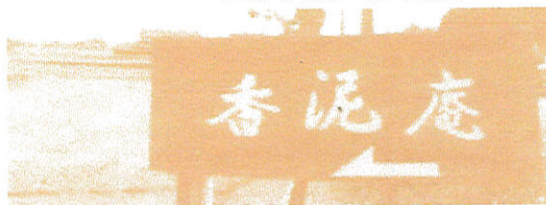
国道13号線のこの看板が目印